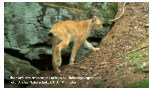
Nachweis des residenten Luchses bei Johanngeorgenstadt

Bereits seit den 1960er Jahren gibt es vermehrt Hinweise darauf, dass der Luchs auch wieder sächsische Wälder durchstreift. Vor allem im Oberlausitzer Bergland, der Sächsischen Schweiz, dem Erzgebirge und dem Vogtland hinterlässt das „Pinselohr“ in unregelmäßigen Abständen seine Spuren. So kommt es hin und wieder zu Einwanderungen aus anderen bestehenden Populationen. Im westlichen Erzgebirge hatte sich von 2013 bis 2019 sogar ein einzelnes männliches Tier etabliert. Und im Sommer 2020 hielten sich zeitweilig gleich drei Luchse aus einem polnischen Wiederansiedlungsprojekt in Sachsen auf.