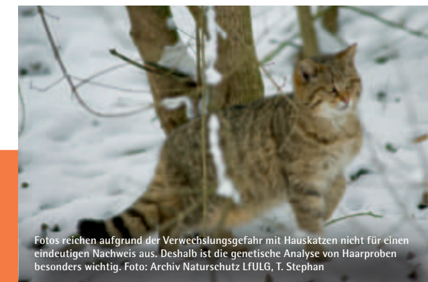
Fotos reichen aufgrund der Verwechslungsgefahr mit Hauskatzen nicht für einen eindeutigen Nachweis aus. Deshalb ist die genetische Analyse von Haarproben besonders wichtig.

In Sachsen galt die Art über 100 Jahre lang als ausgestorben. Erste ungesicherte Hinweise wurden in den 1980er Jahren registriert, vor allem aus der Gohrischheide und dem Vogtland nahe der thüringischen Grenze. Sichere Nachweise des Vorkommens von Wildkatzen auf sächsischem Gebiet konnten seit 2009 vor allem über genetische Analysen von Haaren (Lockstockmonitoring), aber auch durch Verkehrsoffer erbracht werden. Diese Nachweise stammen insbesondere aus dem Südwesten, sowie seit 2015 vermehrt aus dem Nordwesten Sachsens. Einen Schwerpunkt bilden hierbei die kleinen Populationen im Leipziger Auwald und im Werdauer-Greizer-Wald.