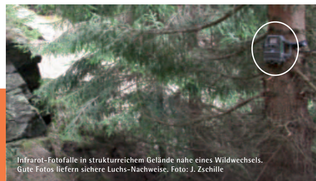
Infrarot-Fotofalle in strukturreichem Gelände nahe eines Wildwechsels. Gute Fotos liefern sichere Luchs-Nachweise.